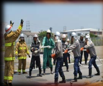
40mm消火ホース ホースハンドリングコマンド