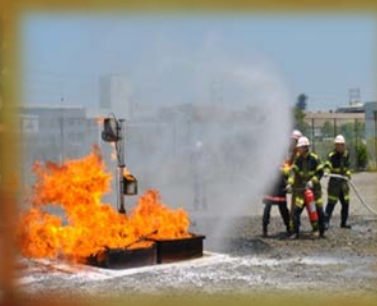
消火器と放水による コンビネーション消火