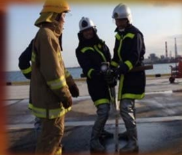
65mm消火ホース取扱い 【2人消火】