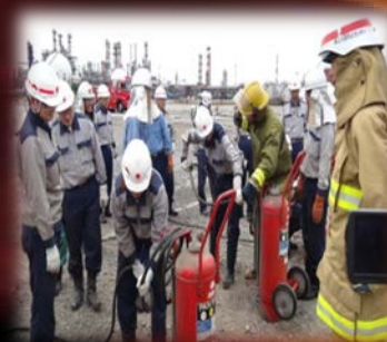
各種消火器の取扱い