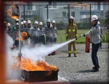
消火器による最初期消火 【1人消火】