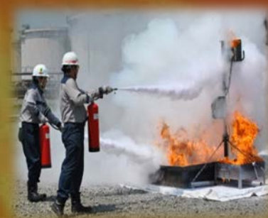
消火器による最初期消火 【2人消火】