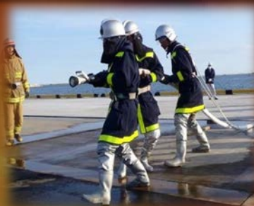
65mm消火ホース取扱い 【3人消火】