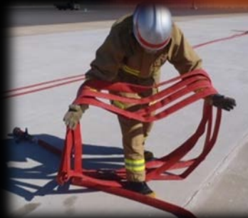
狭い場所で有効なホース捌き 【横横巻き】