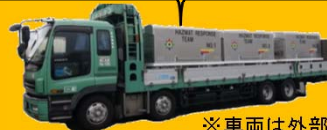
※車両は外部手配 レスポonder-3号 (バルクカート)