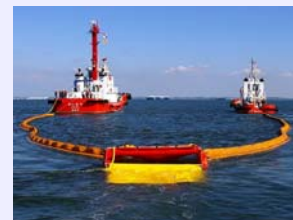
集油型薬剤散布装置