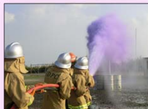
ハイドロケム消火訓練