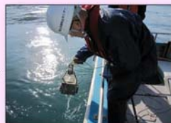
HNS流出事故に伴うサンプリング