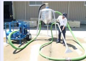
可搬式バキュームクリーナー