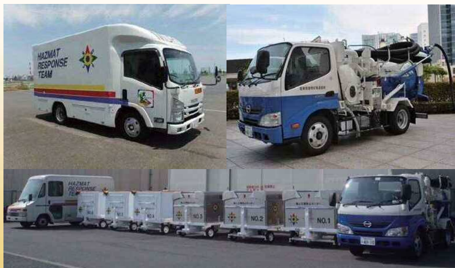
災害対応拠点 川崎基地 & 堺泉北基地 & 北九州基地