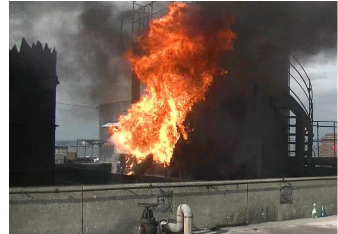
ボイルオーバーの再現