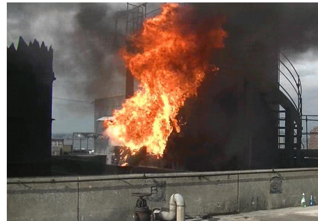
ボイルオーバーの再現